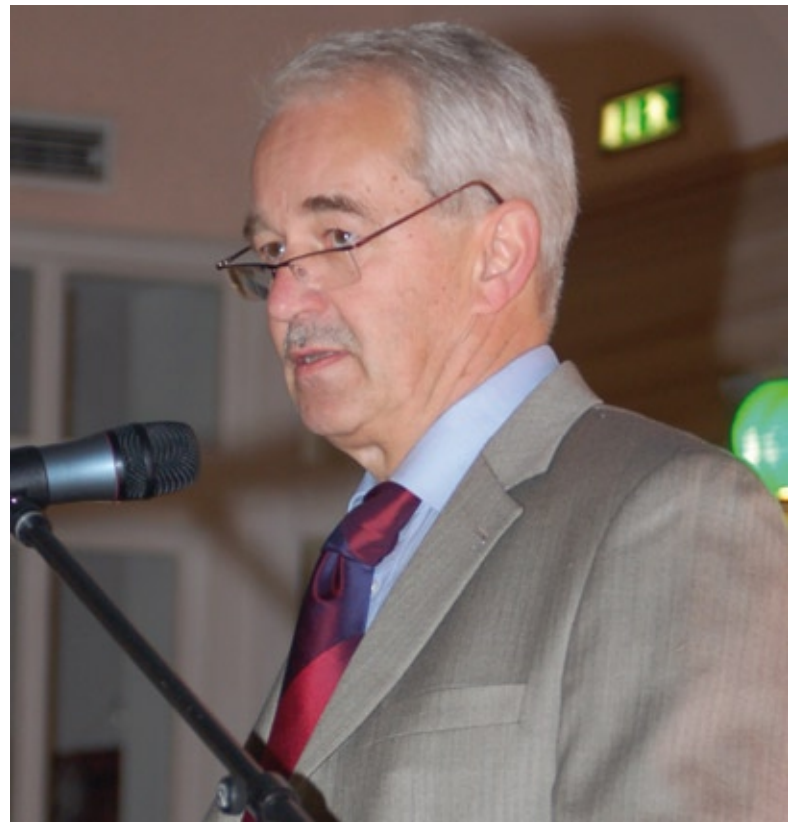
Der MDR-Fernsehdirektor Wolfgang Vietze

Und dann fallen die wichtigsten Worte für alle Beteiligten an der Produktion. Wolfgang Vietze kündigt die Fortsetzung des Erfolgsformates an. Der MDR-Fernsehdirektor wörtlich: „Meine Unterstützung ist Ihnen sicher!“