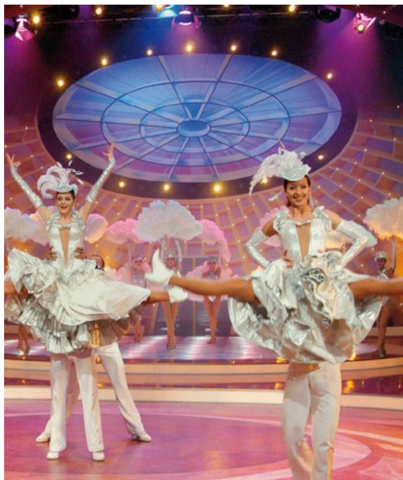
MDR Deutsches Fernsehballett

Schon im Januar steht mit dem Semperoperball in Dresden gleich ein prestigeträchtiger Auftritt im Kalender. Mit dem „Überraschungsfest der Volksmusik“, dem „Musikantenstadl“ und den Geschwistern Hoffmann gehen die Tänzer und Tänzerinnen in diesem Jahr auf Tournee.