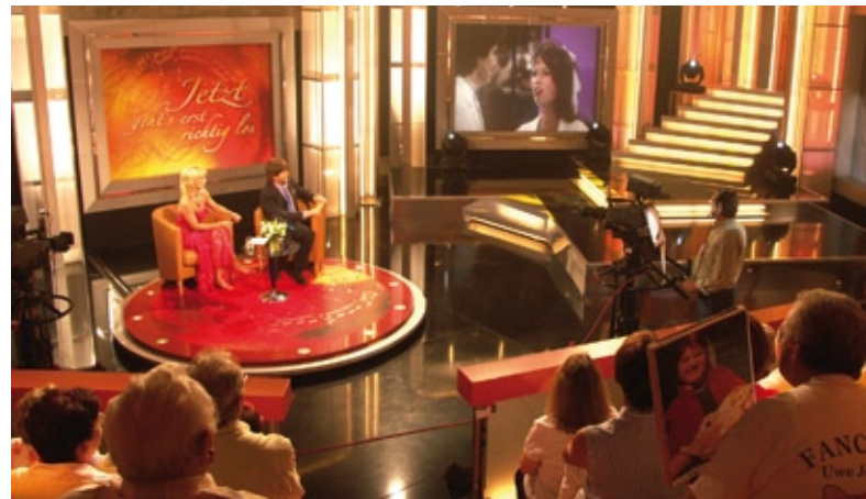
Studiodeko für „Langer Samstag 2006“

Neben dem Tagesbetrieb im Landesfunkhaus hat die MCS zusätzliche Fernsehsendungen nach Magdeburg geholt. Das Foyer im Landesfunkhaus verwandelt sich regelmäßig in ein Fernsehstudio. Sieben Jahre stand die MCS unter anderem der OTTONIA bei „TeleBingo“ als technischer Dienstleister zur Seite. Inzwischen kamen noch „MDR um zwölf“, das Magazin „Kino Royal“ sowie die Quizshow „Quickie“ und der „Lange Samstag“ hinzu. Dieses Geschäftsfeld, betont Dieter Sommerfeld, soll auch in den nächsten Jahren gepflegt werden.