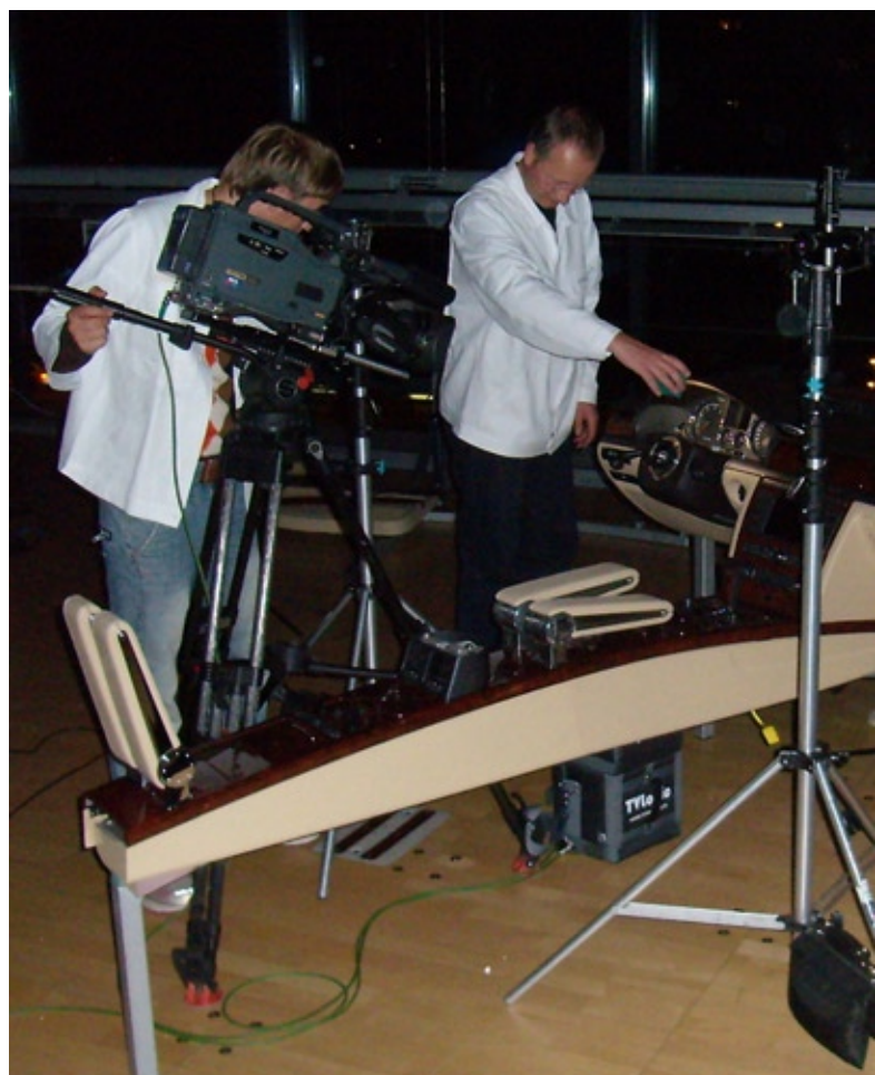
Am Film-Set in der Gläsernen Fabrik in Dresden