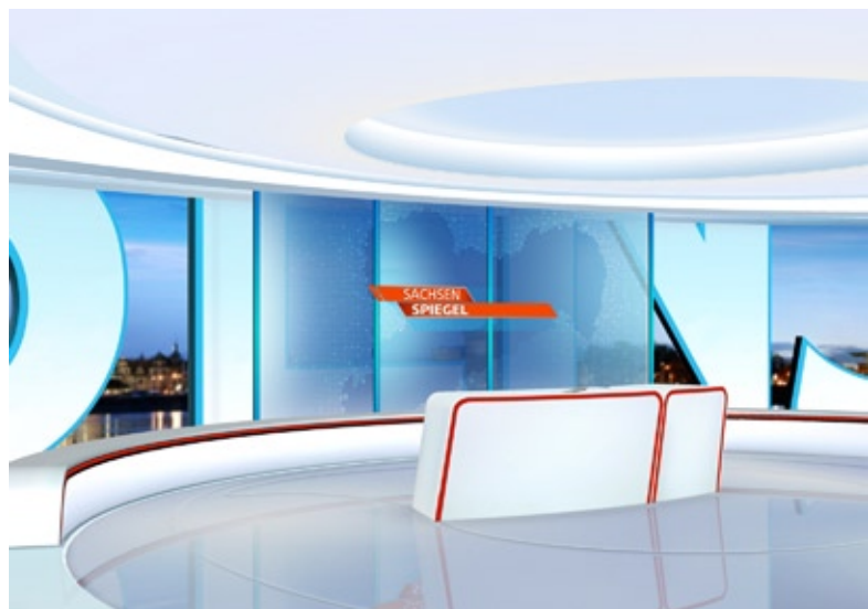
Das neue virtuelle Studio