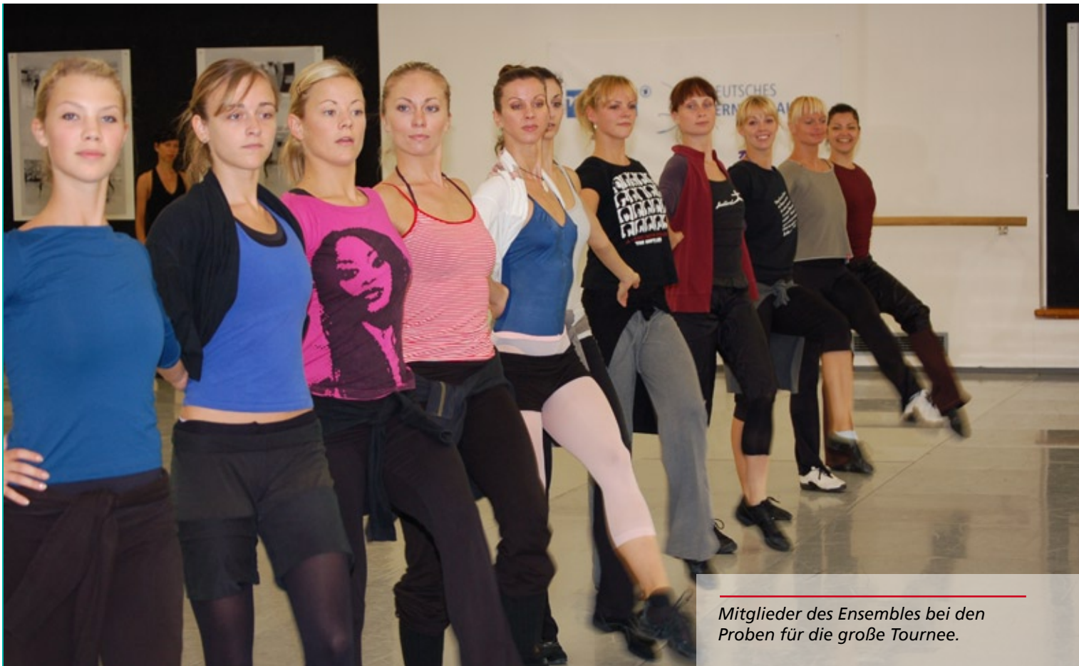
Mitglieder des Ensembles bei den Proben für die große Tournee.

zahlreiche bestanden. Ihr Abitur macht sie am französischen Gymnasium. Später studiert sie Polonistik und Nordamerikastudien und hilft daneben, das jährlich in Warschau stattfindende Festival "Rozdroże" (Kreuzung) zu organisieren. Anders als die anderen neuen Mitglieder, die unter anderem aus Bulgarien und Israel kommen, hat sie keine Schwierigkeiten mit dem Eingewöhnen. „Ich habe alle meine Freunde hier“, sagt sie und bereitet sich schon auf die nächste Trainingsstunde vor.