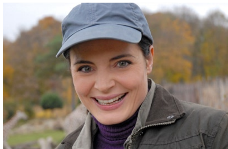
Susanne Lanz spielt die Hauptrolle in der erfolgreichen ARD-Serie.

„Tierärztin Dr. Mertens“ hat ihre Arbeit im Leipziger Zoo wieder aufgenommen. Seit Ende Juli dreht die Saxonia Media Filmproduktionsgesellschaft mbH die dritte Staffel der erfolgreichen ARD-Serie. Die Folgen der zweiten Staffel sahen durchschnittlich 5,48 Millionen Zuschauern. Damit erreichte „Tierärztin Dr. Mertens“ eine Quote von 19,6 Prozent. In den 13 neuen Folgen gibt es ein Wiedersehen mit vielen bekannten Gesichtern. Mit dabei ist auch wieder Gegenspieler und Zoodirektor Dr. Fähmann, gespielt von Michael Lesch. Der bekommt nun auch noch Unterstützung von Susannes Mertens neuer Assistentin Nicole Sommer (Jenny Elvers-Elbertzhagen). Gemeinsam mit ihrem Lebensgefährten Christoph Lenz (Sven Martinek) plant Susanne eine Vergrößerung ihrer Patchwork-Familie – zur Freude ihrer Film-Eltern Gunter Schoß und Ursela Monn als Georg und Charlotte. Die neuen Episoden sollen voraussichtlich 2010 gesendet werden.