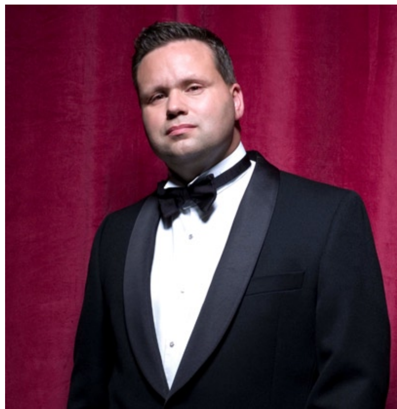
Paul Potts

Bereits zum 14. Mal wird der MDR am 18. Dezember 2008 ab 20.15 Uhr die José Carreras Gala im Ersten live aus Leipzig übertragen. Gastgeber José Carreras und Moderator Axel Bulthaupt werden auch dieses Jahr durch einen stimmungsvollen Gala-Abend mit nationalen und internationalen Künstlern führen und bewegende Schicksale von Leukämiepatienten zeigen. Mit Spannung werden die ersten Zusagen der Künstler, die von José Carreras eingeladen wurden, erwartet. Wer wird diesmal nach Leipzig kommen und den Startenor in seinem Anliegen unterstützen, Menschen mit Leukämie zu helfen und zu heilen? Auch 2008 wird es ein abwechslungsreiches Musikprogramm mit der bewährten Mischung aus Klassik, Crossover, Pop und natürlich José Carreras geben. Seit seiner Leukämie-Heilung kämpft Startenor José Carreras unermüdlich für sein Ziel: „Leukämie muss heilbar